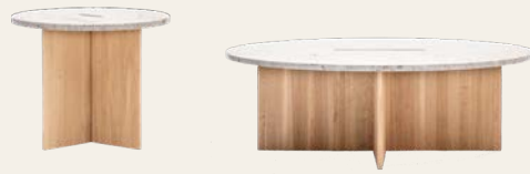
N - ST01