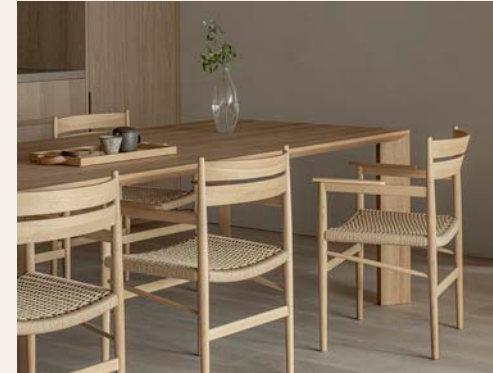
N - DC 0 4

ohne das Signal einer Fernbedienung zu blockieren.