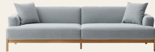
A - S 0 1

für einen ausgewogenen, harmonischen Look.