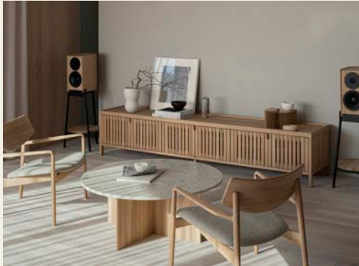
A - LB 0 1