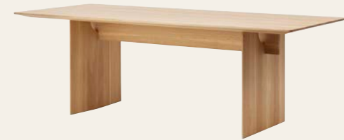
N - DT01

Die abgerundete Marmorplatte hebt die sich darunter befindende Holzkonstruktion durch einen subtilen Ausschnitt hervor und betont das Verhältnis zwischen den Materialien.