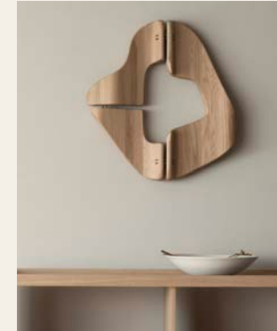
AP - PLATEAU 01 DESIGN: ATELIER PLATEAU

Für das Kunstwerk Outward and Inward werden lange rechteckige Massivholzstücke so geschichtet, dass sie miteinander verwoben zu sein scheinen, was einen in den Raum greifenden und zugleich ruhigen Ausdruck erzeugt.