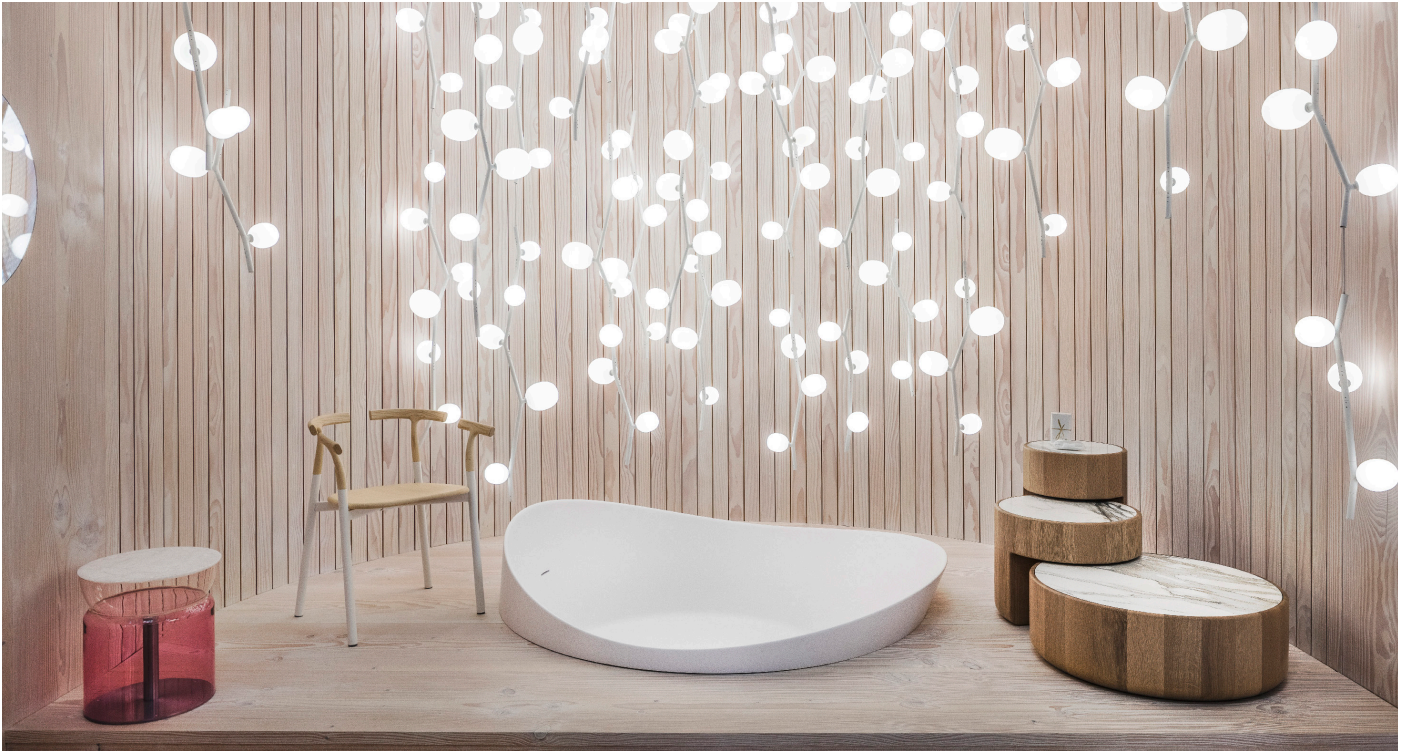
PURO SPARKLE, Design: Lucie Koldova

Die böhmische Premium-Leuchtenmarke Brokis freut sich über die Teilnahme an der diesjährigen Clerkenwell Design Week in London Vom 22. – 24. Mai 2018.