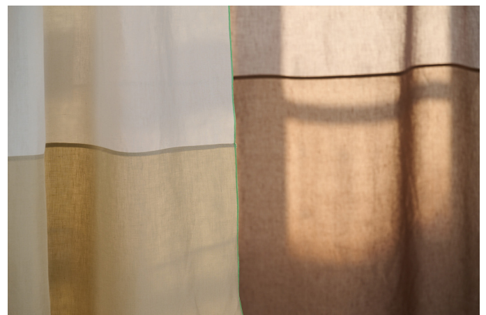
lavie-Telos-Color-Block-shell-beige-mood-Photo Ruedi Flueck.jpg

Bei Verwendung des Bildmaterials bitte nennen: Photo Ruedi Flück