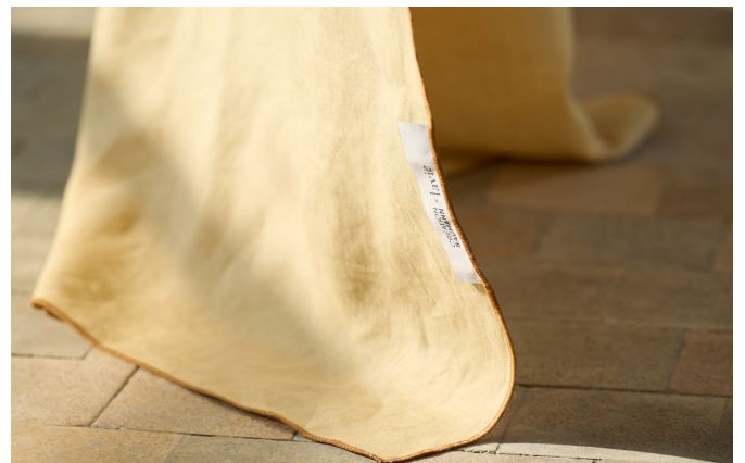
lavie-Telos-Color-Block-rose-pear-label-Photo Ruedi Flueck.jpg