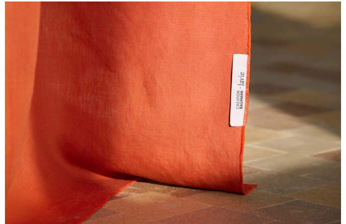
lavie-Telos-Color-Block-hblau-rost-label-Photo Ruedi Flueck.jpg