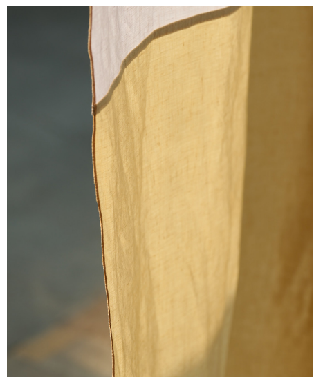
lavie-Telos-Color-Block-rose-pear-closeup-Photo Ruedi Flueck.jpg

Bei Verwendung des Bildmaterials bitte nennen: Photo Ruedi Flück