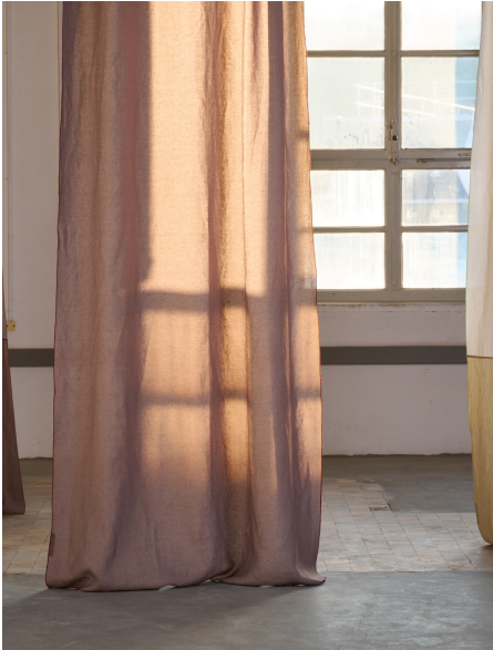
lavie-Telos-grape-Photo Ruedi Flueck.jpg

Für hochauflöste Bilder kontaktieren Sie bitte Brand. Kiosk via: creation-baumann@brand-kiosk.com