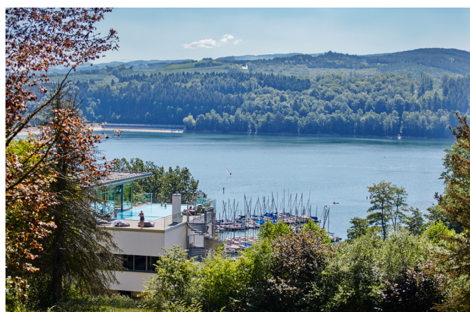
studio aisslinger_Hotel Seegarten__Thiemann_1.jpg