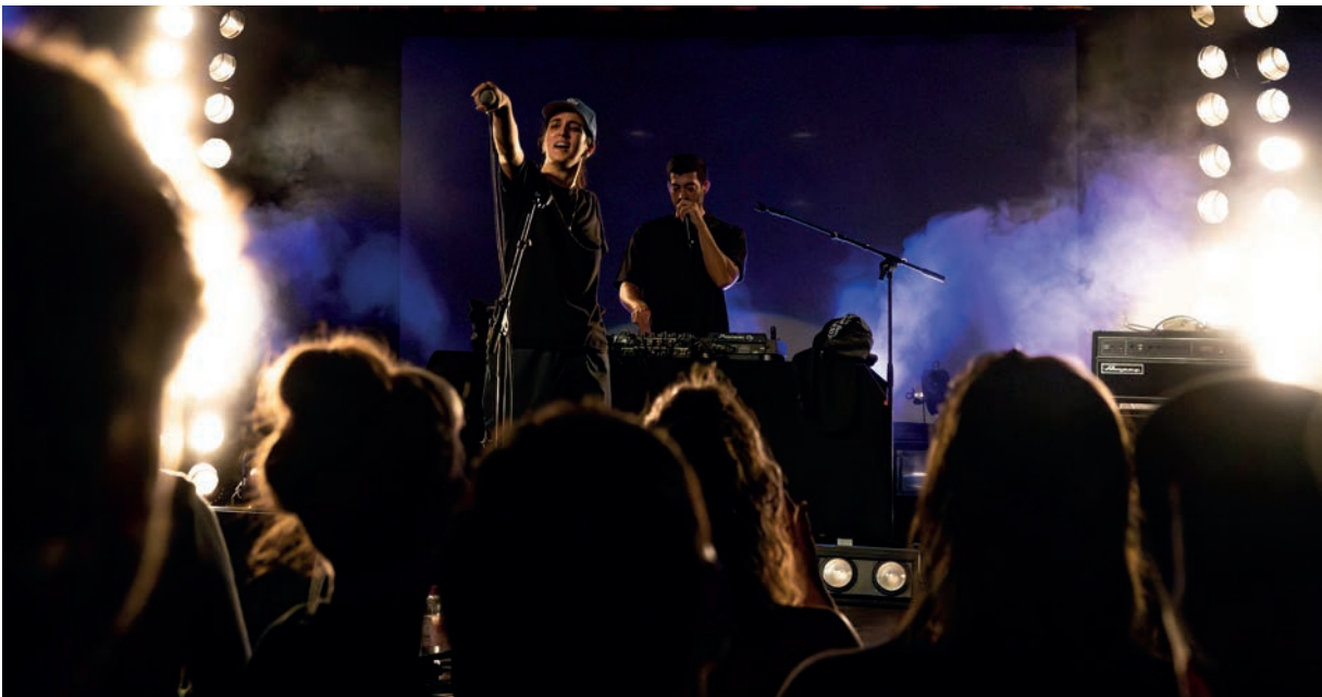
RAPPERIN EBOW AUF DEM RIVIERA FESTIVAL 2023.

Der Zeitplan für das Festival, alle Veranstaltungsorte und weitere Infos zum Line-up finden sich hier: www.riviera-offenbach.de